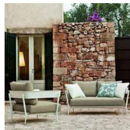
Salon de jardin Aikana