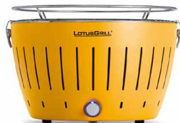
Lotusgrill : barbecue portable au charbon de bois

LOTUSGRILL, c'est l'hôte idéal pour des barbecues réussis !