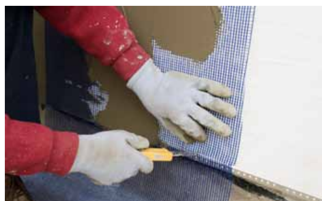
Isolation extérieure et intérieur, décoration, peintures, etc.