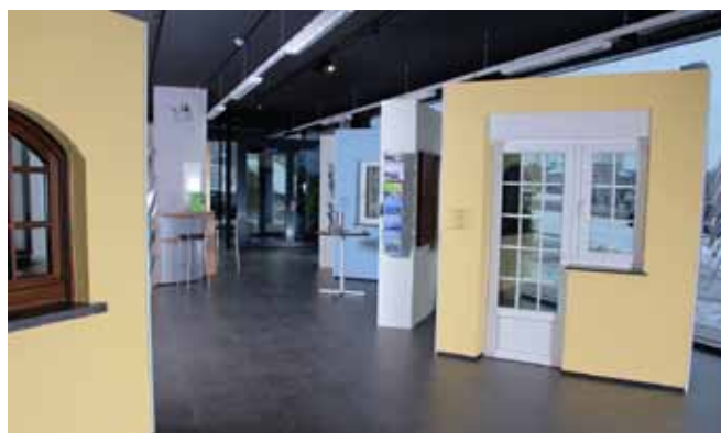
Le showroom de Wako à Differdange

Visitez le show-room WAKO à Differdange-Niederkorn dès maintenant et laissez-vous convaincre par les conseils spécialisés de son équipe de vente.