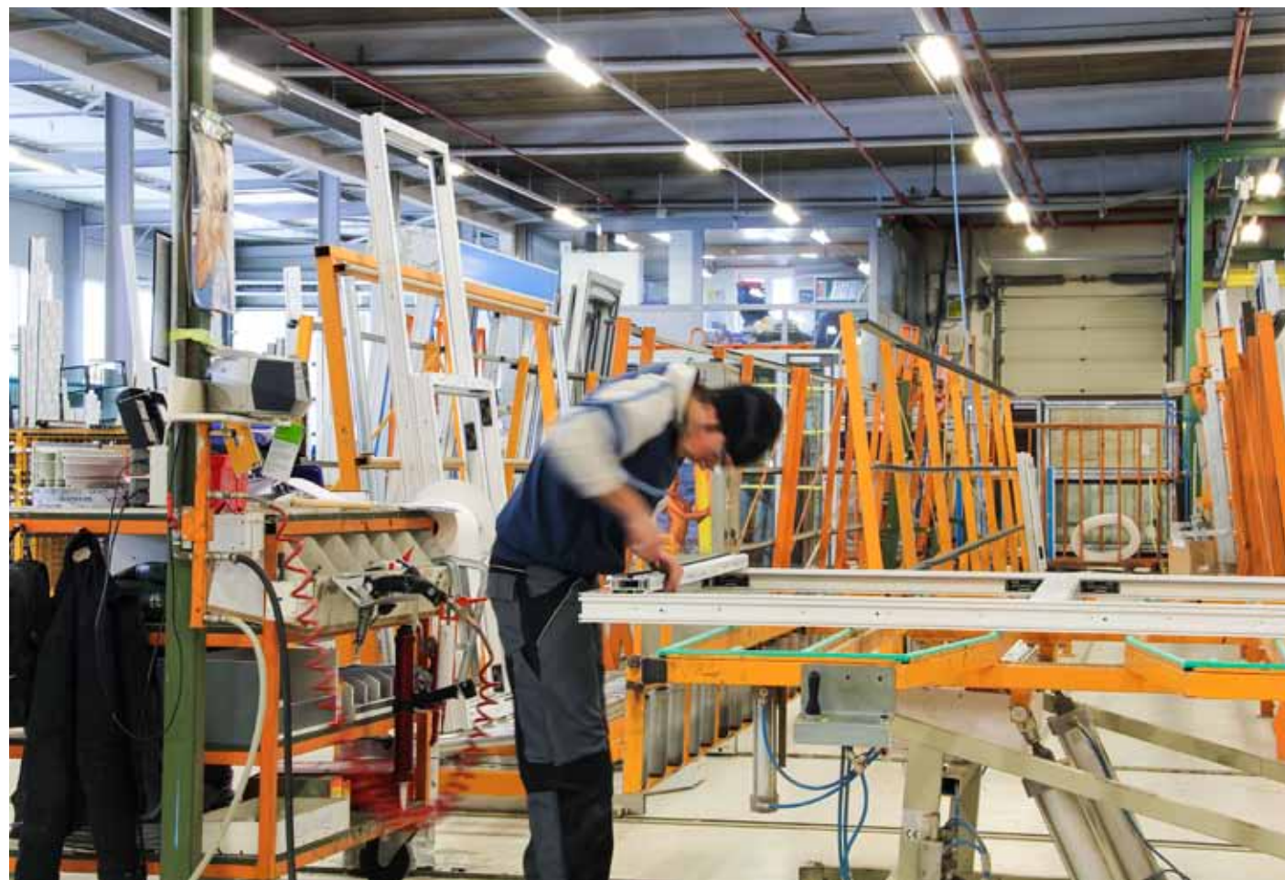
Dans les ateliers de Wako à Rédange/Attert