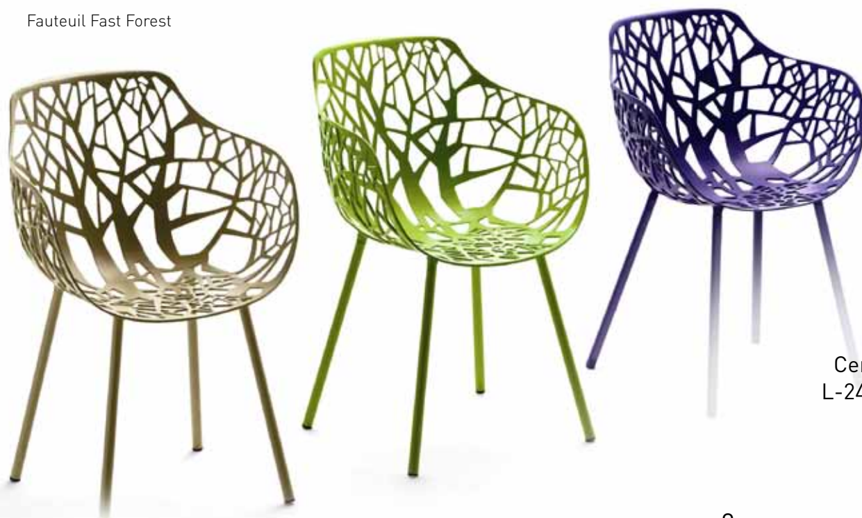
Fauteuil Fast Forest

Sichel-Home Centre Orchimont 34, Rangwee L-2412 LUXEMBOURG-HOWALD Tel: +352 50 47 48 Fax: +352 50 47 48 36 www.sichel-home.lu